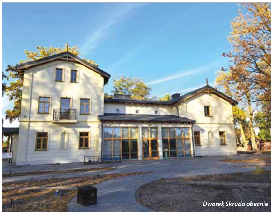
Dworek Skruda obecnie

W lipcu 2022 r. rozpoczęła się rewitalizacja parku wokół dworku „Skruda”. W pierwszym etapie zostały wykonane prace od strony ul. Malinowej, wraz z budową tejże ulicy. Wykonanie drogi dojazdowej i parkingów jest niezbędne do uzyskania pozwolenia na użytkowanie i zmodernizowane budynku. Prace są już zakończone. Na budowę ul. Malinowej pozyskaliśmy 1 mln zł środków zewnętrznych z Rządowego Funduszu Rozwoju Dróg. W drugim etapie powstają: place zabaw, dwie fontanny – chodnikowa i nieckowa, ławeczki, stojaki na rowery, źródło wody pitnej, oświetlenie całego terenu, wykonanie zieleni w tym dosadzenie około 50 drzew, ponad 6000 krzewów, 8500 bylin oraz 1400 roślin cebulowych. Ponadto powstaje skatepark, siłownia zewnętrzna, boisko do piłki plażowej, plac zręcznościowy obejmujący zestawy linowe, a także zrewitalizowany staw z domkiem dla kaczek.