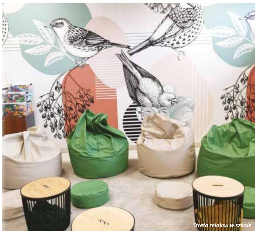
Strefa relaksu w szkole

„Bezpieczny uczeń na rowerze w gminie Halinów”