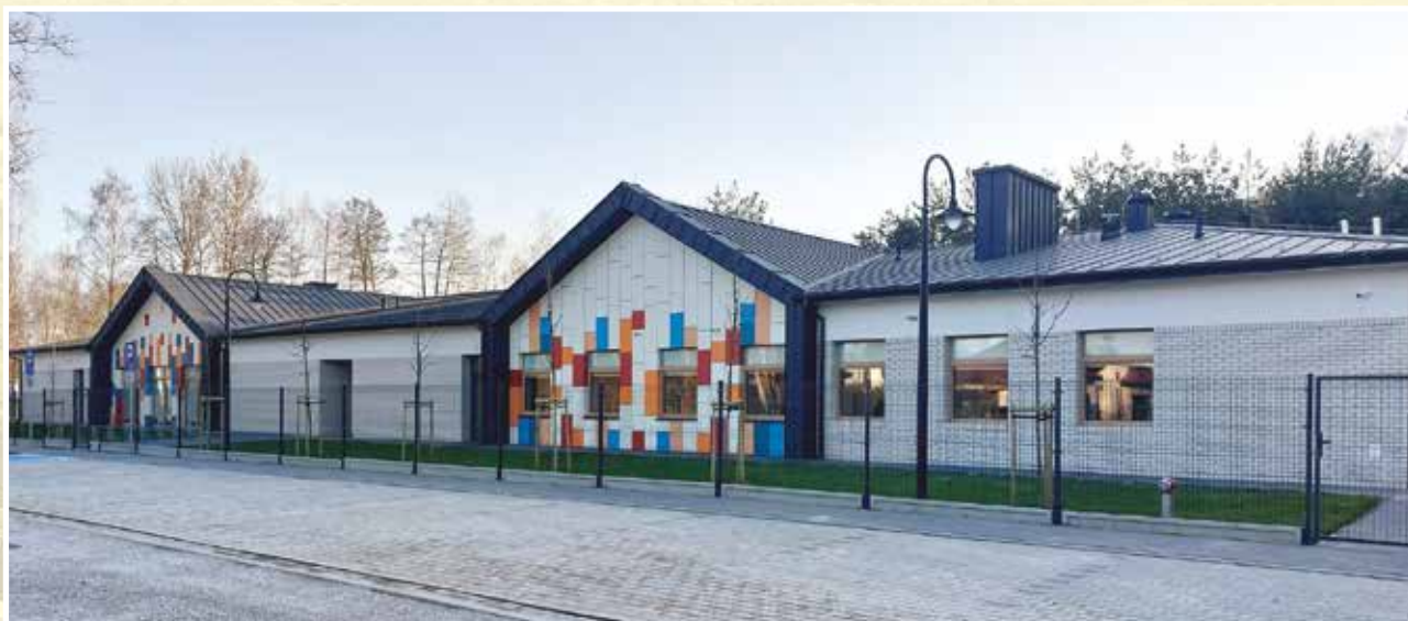
Przedszkole w Hipolitolwie