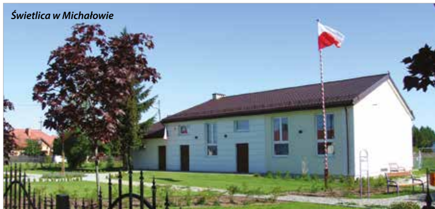
Świetlica w Michałowie