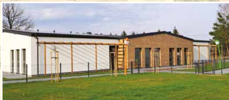
Żłobek w Długiej Szlacheckiej