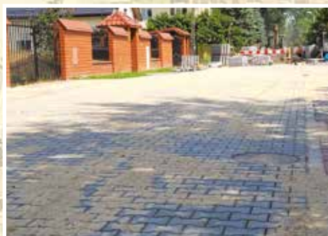
Ulica Paderewskiego w Halinowie