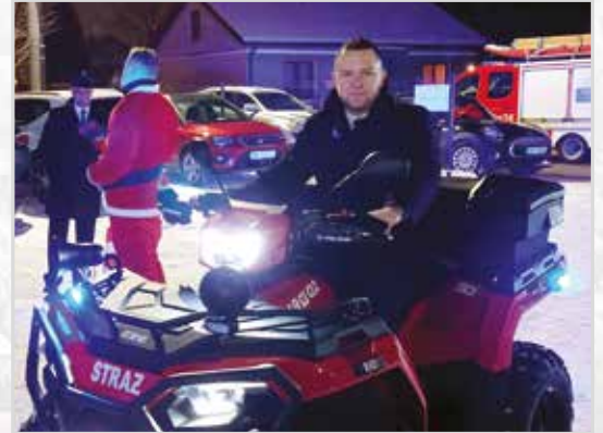
Nowy quad dla OSP Długa Kościelna