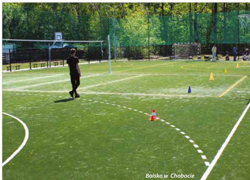
Boisko w Chobocie