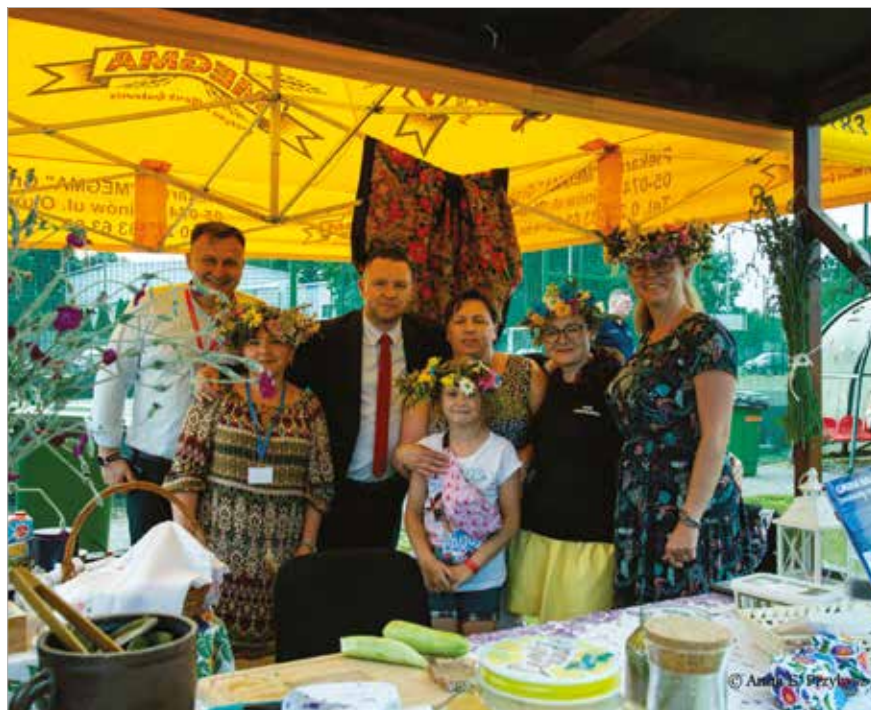
KGW „Cisiowianki” ze swoim stoiskiem na Święcie Miasta i Gminy Halinów 2023.