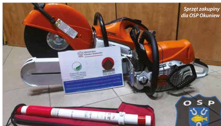
Sprzęt zakupiony dla OSP Okuniew

tu gminy pozyskiwano na ten cel środki z Urzędu Marszałkowskiego Woj. Mazowieckiego. W tym roku trwają starania, aby dla OSP Okuniew zakupić ciężki wóz bojowy. Byłby to pierwszy taki pojazd na stanie naszych jednostek. Gmina Halinów zabezpieczyła na ten cel w budżecie 500 tys. zł, Urząd Marszałkowski przekazał 150 tys. zł. Kolejne wnioski na ten cel są w trakcie oceny. Z kolei OSP Długa Kościelna w grudniu 2023 r. stała się posiadaczem quada bojowego, który został dofinansowany ze środków KGHM. Jak mówią strażacy, wiedzie się nim tam, gdzie inne pojazdy nie wjadą.