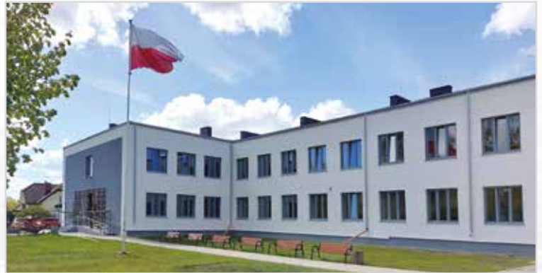
Szkoła w Okuniewie