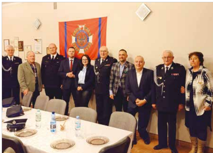
Walne zgromadzenie w OSP Cisie