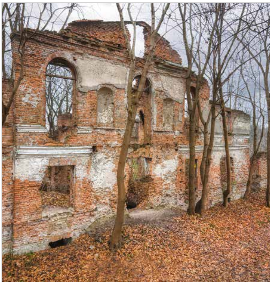
Ruiny Pałacu Łubieńskich w Okuniewie

Odpowiedź paradoksalnie znali już właściciele różnych pałaców dwieście i trzysta lat temu. Bowiem w czasach kiedy nie było prądu, a właściciele chcieli pochwalić się budowlą i uatrakcyjnić wielkie uroczystości – zwielokrotniali oświetlenie wnętrza. Wówczas ogromne żyrandole napełniały się ogromną ilością świec, a liczne świeczniki i kandelbary