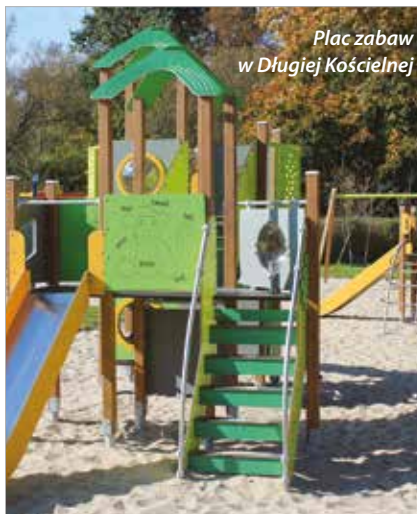
Plac zabaw w Długiej Kościelnej