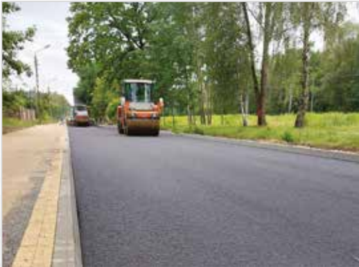
Ulica Bema w Halinowie