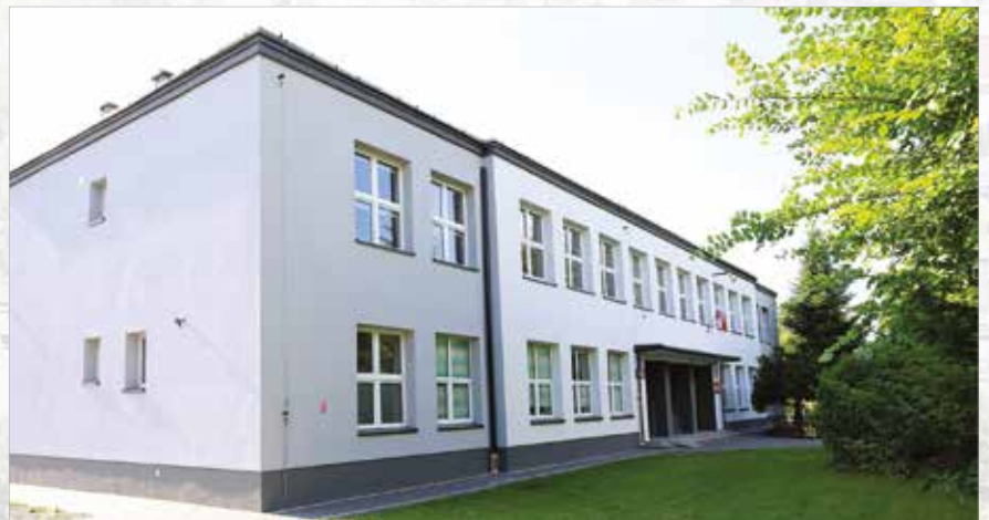
Szkoła w Cisiu