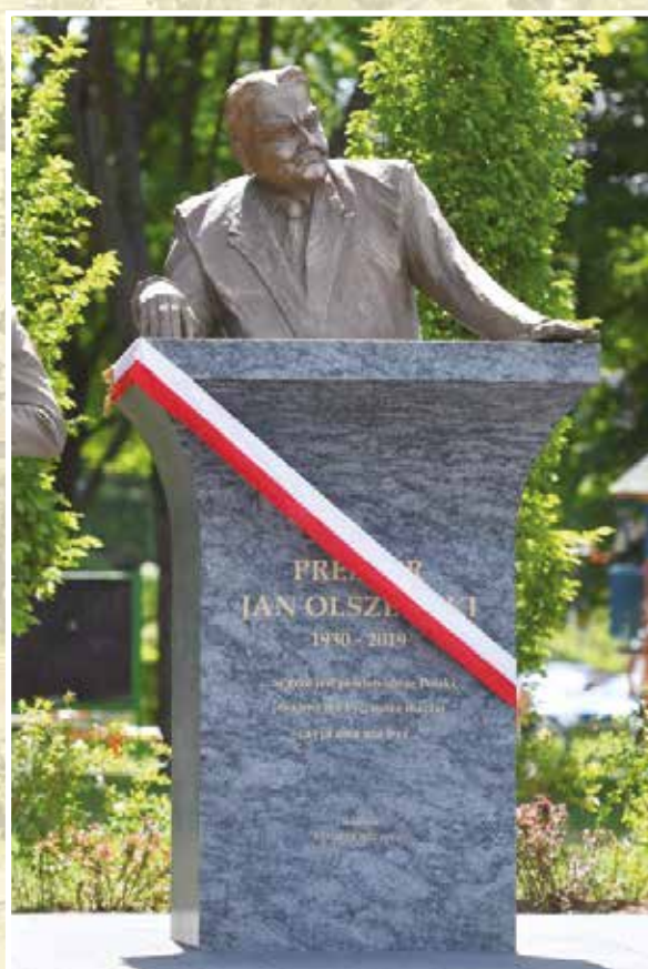
Pomnik Jana Olszewskiego w Okuniewie