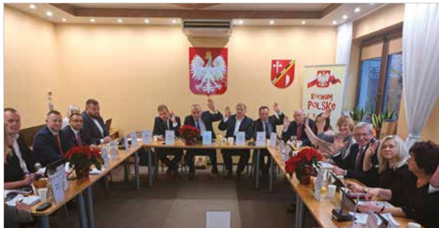
Rada Miejska w Halinowie – koniec kadencji 2019-2024

tych wybudowana została linia oświetlenia w ul. Okuniewskiej-Kochanowskiego-Wyszyńskiego oraz wymienionych zostało na energooszczędne LEDy ponad 1,5 tys. zł punktów oświetlenia na tere-