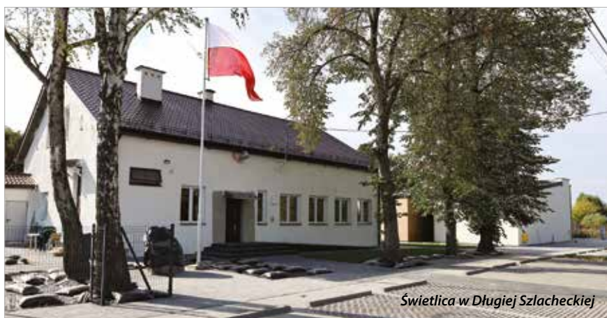
Świetlica w Długiej Szlacheckiej