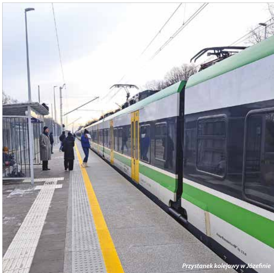
Przystanek kolejowy w Józefinie