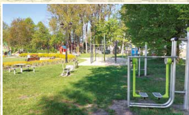
Plac rekreacyjny w Długiej Kościelnej