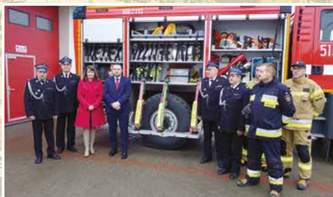
Nowy wóz bojowy dla OSP Cisie