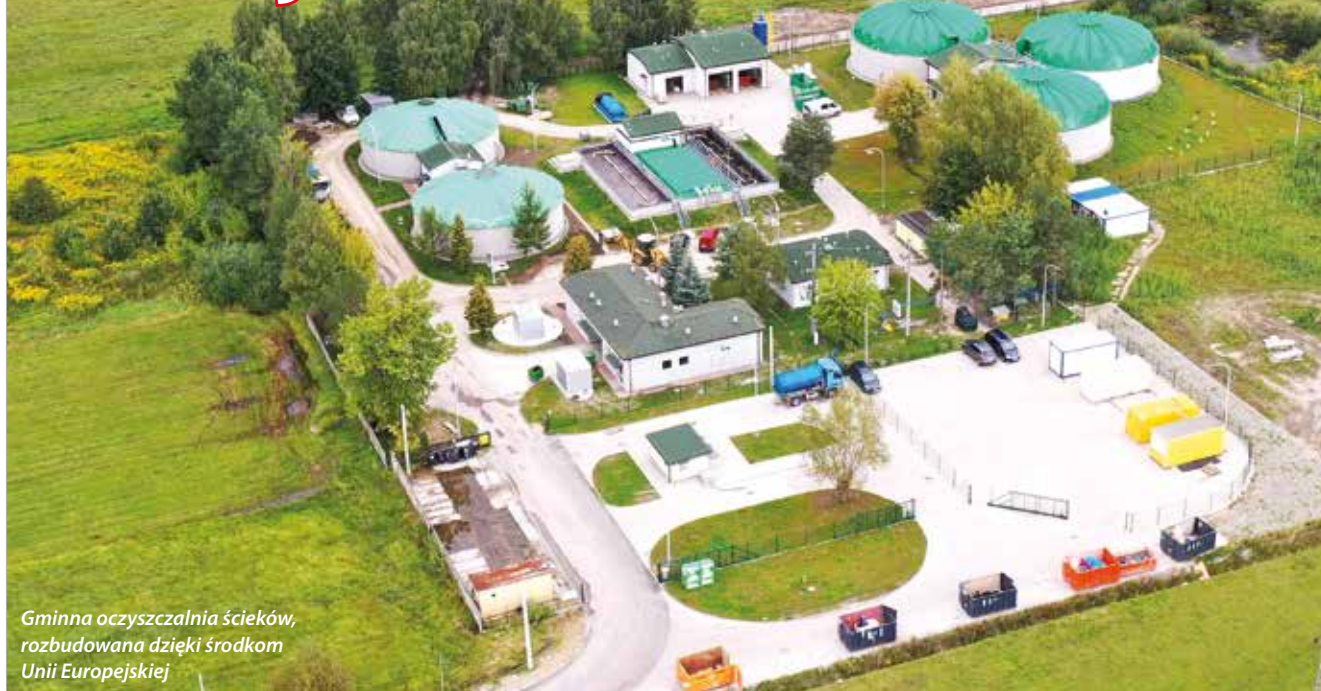
Gminna oczyszczalnia ścieków, rozbudowana dzięki środkom Unii Europejskiej

W czwartek 29 lutego 2024 roku odbył się ostatni akt projektu „Poprawa gospodarki ściekowej w gminie Halinów” realizowanego w ramach dofinansowania ze środków pochodzących z Funduszu Spójności Unii Europejskiej. Aktem tym było wniesienie przez Gminę Halinów aportu w postaci rozbudowanej i wyremontowanej oczyszczalni ścieków w Długiej Kościelnej na majątek Zakładu Komunalnego w Halinowie spółka z o.o.