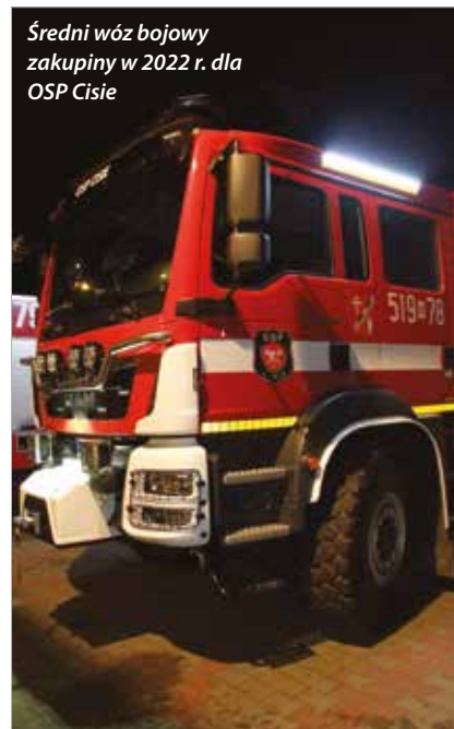
Średni wóz bojowy zakupiony w 2022 r. dla OSP Cisie

każda z nich, rok do roku ma na koncie ponad sto interwencji. Mieszkańcy dobrze wiedzą, jak cenną pomoc otrzymują od strażaków. Dlatego środki z funduszy sołeckich w znacznej części są przeznaczane na wsparcie straży. W ten sposób m.in. przekazano środki na remont strażnic w Okuniewie, Długiej Kościelnej czy Cisia. Ale nie tylko. Przeznaczane są także na bieżące zakupy umundurowania galowego i bojowego. Ponadto, na sprzęt spalinowy, typu piły do betonu czy stali, defibrylatory,