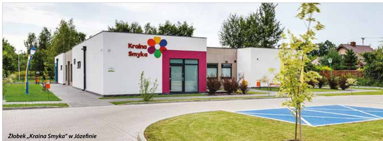
Złobek „Kraina Smyka” w Józefinie

R. Dziękuję za rozmowę. I gratuluję wytrwałości. ●